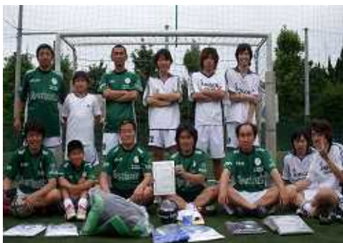
優勝「アミーゴス ジュニア」