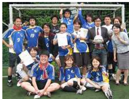
第2位「西戸山サル軍団」