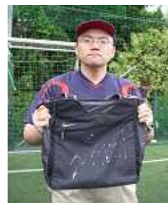
ポンテ選手 サイン入りバッグ