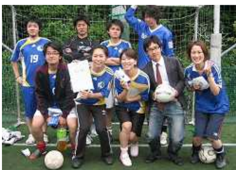
第3位「西戸山イヌ軍団」