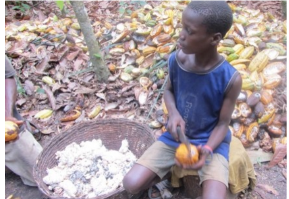
▲ガーナのカカオ農園で児童労働に携わる子ども

児童労働とは、義務教育を妨げる労働や法律で禁止されている 18 歳未満の危険・有害な労働のことを指します。日本がカカオの約 7 割を輸入するガーナでは、カカオの収穫や運搬などの農作業に従事する児童労働者の数は 77 万人。そのうち農薬散布などの危険有害労働に従事する子どもは 71 万人 (92%) です。(2020 年シカゴ大学 NORC 調査報告書より) 本映画の製作は 2012 年ですが、カカオ生産地の児童労働は現在も生産地の子どもたちに影響を及ぼす大きな課題です。