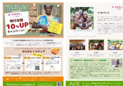
呼びかけ用チラシ